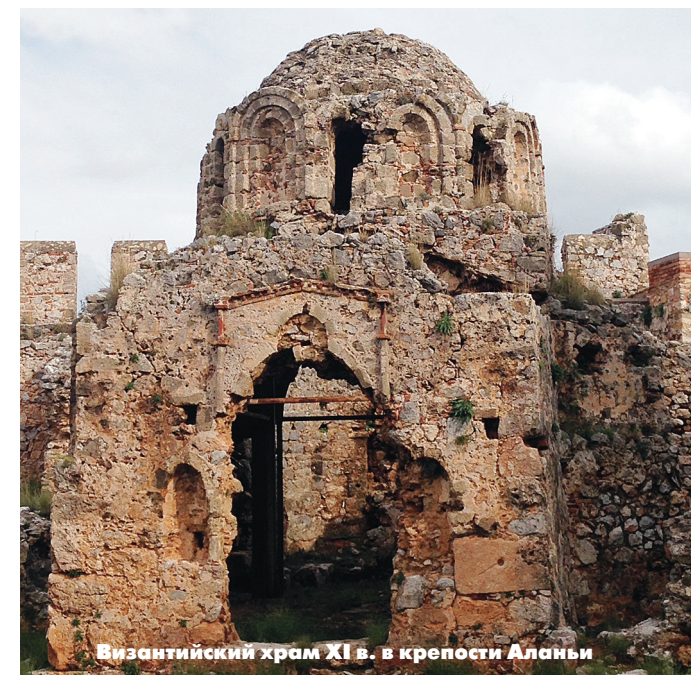
Византийский храм XI в. в крепости Аланьи